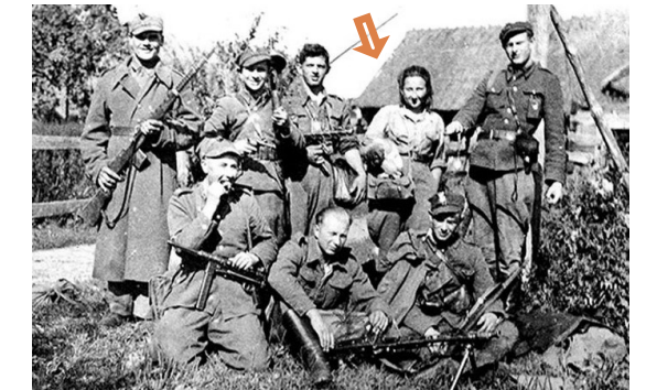
Żołnierze 4. szwadronu 5. Wileńskiej Brygady Armii Krajowej. Białostoczczyzna, lato 1945 r.