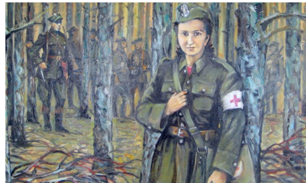
Autor obrazu: Marian Stefański z Warszawy - artysta, malarz, rotmistrz kawalerii ochotniczej. Obraz został podarowany Szkole Podstawowej w Podjazdach w woj. pomorskim w powiecie kartuskim w dniu nadania imienia 23 maja 2009 r.